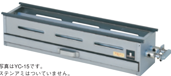
写真はYC-15です。 ステンアミはついていません。