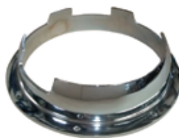
三重用中華ワッパ