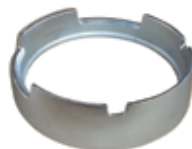
二重用中華ワッパ