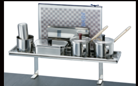
メニュースタンド (付属品は別売) ¥30,000