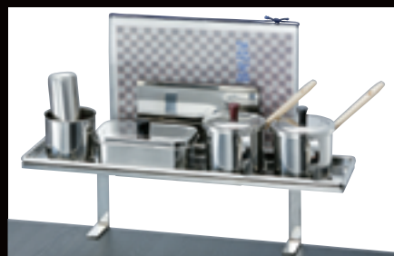
メニュースタンド (付属品は別売) ¥10,000